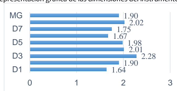
Figura 1. Representación gráfica de las dimensiones del instrumento de medición

De acuerdo a los resultados obtenidos, por un lado, las dimensiones que identifican los estudiantes y se ubican por encima de la media general son las dimensiones D2 salud, D3 educación, D4 familia, D5 seguro de vida, D8 gobierno y por el otro, las dimensiones que no identifican los participantes encuestados y se ubican por debajo de la media general son D1 nutrición, D6 ahorro y D7 emprendimiento. La dimensión que más se identifica con los factores de pobreza en el aprendizaje es la dimensión D3 educación. En la figura 1 se observan los resultados de las medias por dimensión y general de manera gráfica.