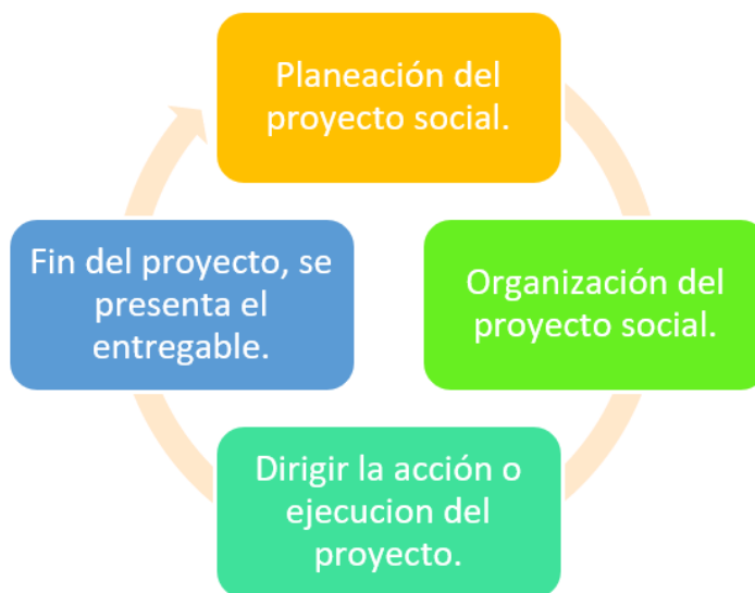
Figura 2. Ciclo de vida del proyecto.

La planeación tiene como objetivo principal la integración y participación social del total de los habitantes de esta comunidad [2]. Esta iniciativa presenta un enfoque participativo ya que cada uno de los habitantes va a tener el conocimiento de cómo ser autoprodutores de sus propios insumos alimenticios y de vivienda, pero lo más importante es que estos últimos insumos sean vendidos a precios muy bajos y que con esta nueva fuente de ingreso impacte positivamente a reactivar la economía de acuerdo al ciclo de vida del proyecto (Fig. 2)